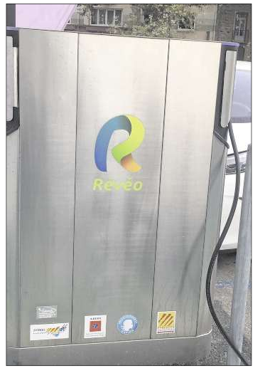
■ L'autonomie, réel enjeu.